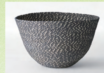
奨励賞 twist knitting basket-dark twinkle-／金森絵美