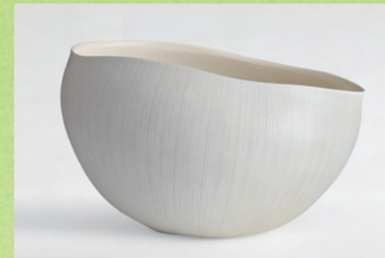
特別賞・十四代柿右衛門記念賞 緋舟 風／佐藤典克