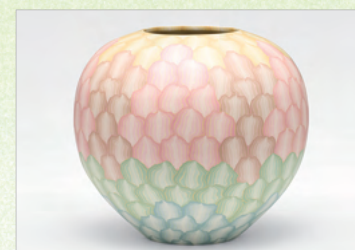
奨励賞 棕灰釉練上大壺／松井康陽