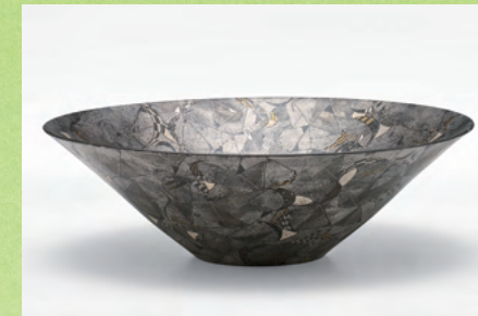
特別賞・高島屋賞 幾何紋白金彩鉢／多田幸史