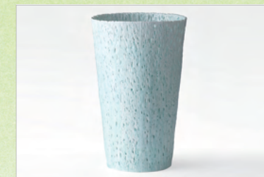
奨励賞 光の色／竹村智之