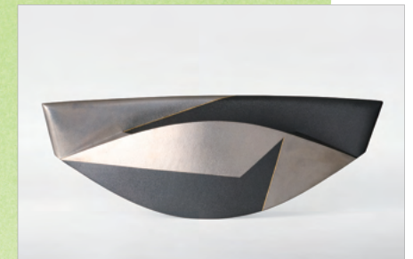
特別賞・ギャラリー山咲木賞 銀彩扁壺-KATANA／西本直文