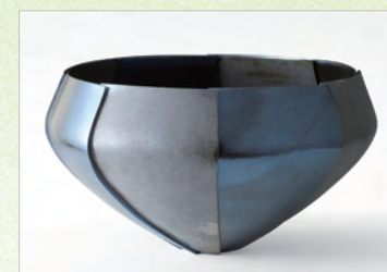
奨励賞 切り継ぎ黒彩鉢／森山寛二郎